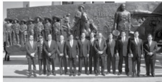
El grupo de gobernadores se concentró en una reunión de trabajo para el Corredor Económico del Norte.

Afirmó que ninguna zona del País ofrece hoy en día todos estos factores de desarrollo como los tiene el Corredor Económico del Norte, donde además ya existen proyectos en construcción que detonarán el crecimiento, como lo son el gasoducto, que hará de Sinaloa el estado con la mayor capacidad energética de esta zona, sin contar la construcción de tres plantas generadoras de energía eléctrica, y la modernización de las dos termogeneradoras existentes, que serán convertidas a ciclo combinado, que darán