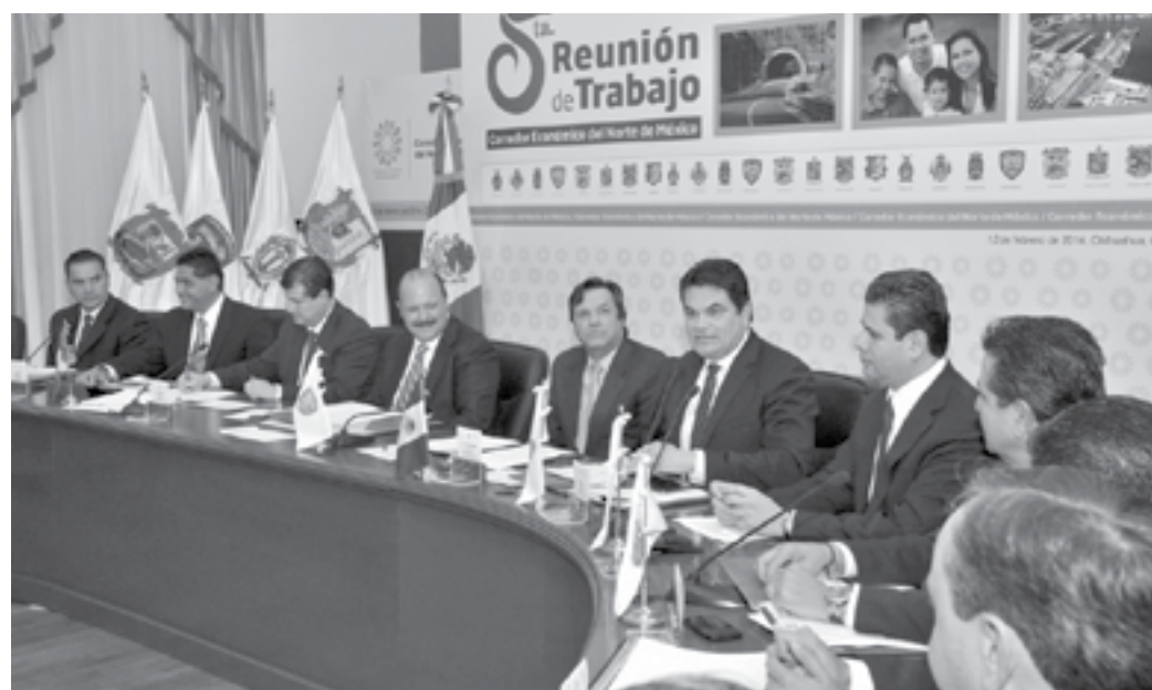
El Gobernador Mario López Valdez durante la Quinta Reunión Plenaria del Corredor Económico del Norte.

La nueva plaza comercial con anclas como Soriana, Cinépolis y Coppel, contará con cerca de 254 locales comerciales.