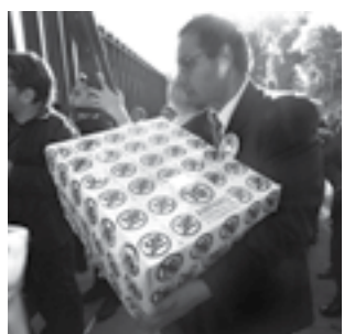
Presentaron un amparo colectivo contra el IVA.

"Queremos contribuir con nuestros impuestos pero tie-